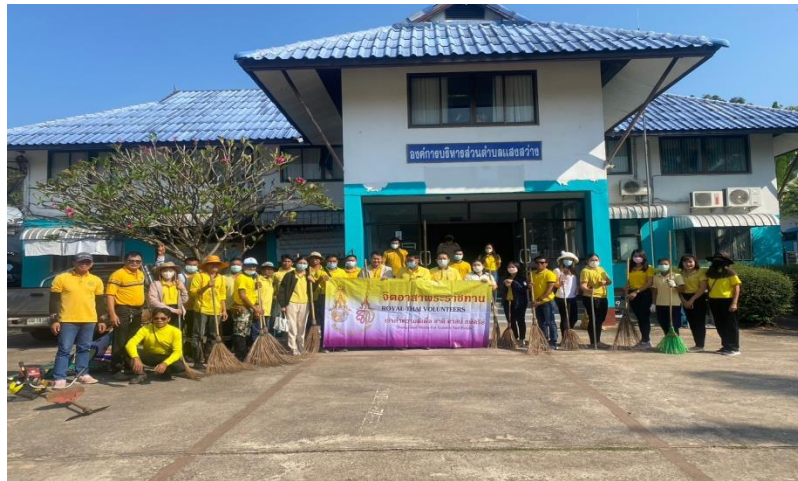
จิตอาสาเมื่อวันพฤหัสบดี ที่ ๒๓ กุมภาพันธ์ ๒๕๖๖