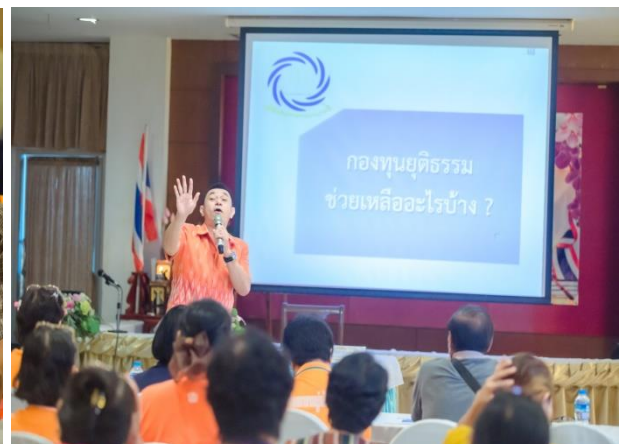
(เวลา ๐๙.๐๐-๑๐.๓๐ น.)