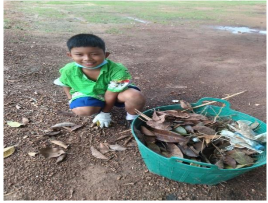
- กิจกรรม Big Cleaning Day