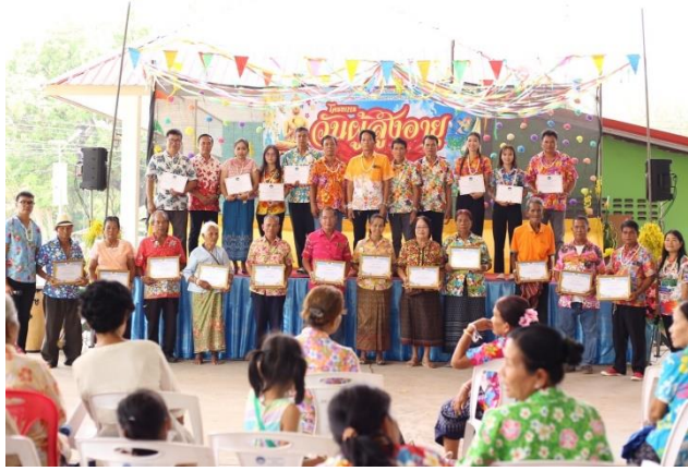
มอบใบประกาศยกย่องผู้มีคุณธรรมและจริยธรรมของประชาชน

ภาพยกย่องบุคลากรที่มีคุณธรรม จริยธรรมขององค์กร และประชาชนทั่วไป