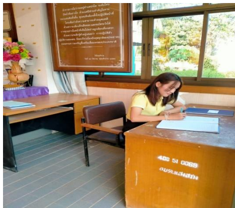
- กิจกรรมติดตาม ควบคุมการมาปฏิบัติราชการของบุคลากร (สมุดลงเวลาปฏิบัติงาน)