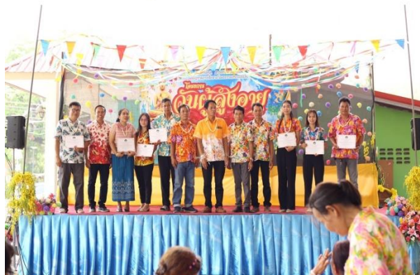
มอบใบประกาศยกย่องผู้มีคุณธรรมและจริยธรรมของบุคลากรในหน่วยงาน