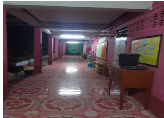
- การจัดเวรยามของข้าราชการ เพื่อระมัดระวังมิให้เสียหายต่อ ทรัพย์สินของทางราชการ